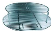
Grille en inox à deux étages