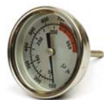
Thermomètre Ø 7 cm