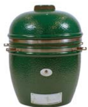
Monolith – Corps et couvercle