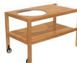
Table en bois teck recyclé avec roues à roulement à billes et espace prédécoupé cerclé de métal pour le grill