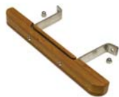
Poignée en bambou