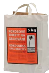
Charbon de coco