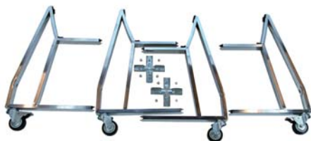
Pieds à roulettes