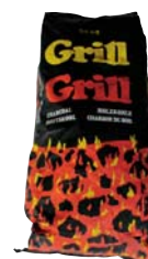
Charbon de bois