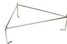
Support pour grille ou pierre à pizza