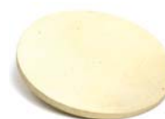
Pierre à pizza Ø 35 cm