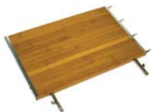
Deux tablettes latérales en bambou