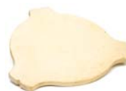
Déflecteur de chaleur