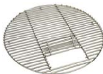
Grille en inox Ø 46 cm